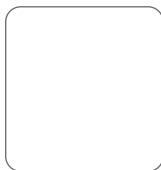
Huella del Solicitante Índice derecho

Dirección para notificaciones: Calle 82 N° 11 - 37 Piso 7 - Bogotá, D.C. - Colombia Código del Clausulado: 29/07/2019 - 1308 - P - 34 - SU-OD-58-01-VGTA - D001 Código de la Nota Técnica: 29/07/2019 - 1308 - NTFP - 34 - NTVIGR2017-TAMP1